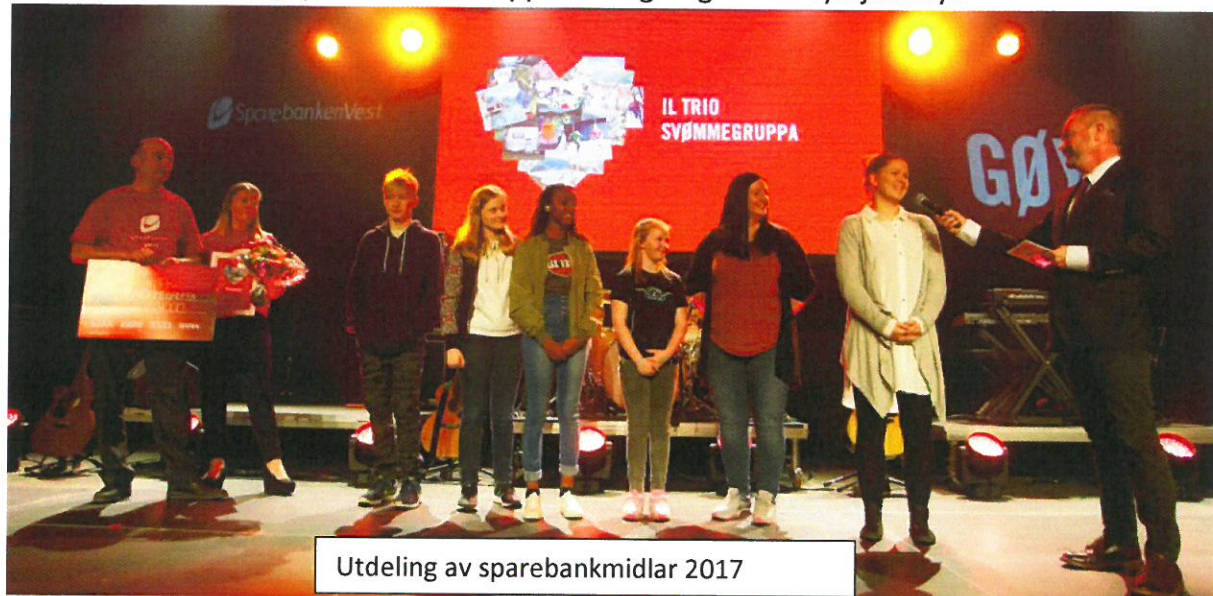
Utdeling av sparebankmidlar 2017

Det må også nemnast at symjegruppa fekk pengegåve frå Sparebank Vest på 50 000 kroner, gåva er nytta til innkjøp av to brukte oppbevaringsvogner for symjeutstyr.